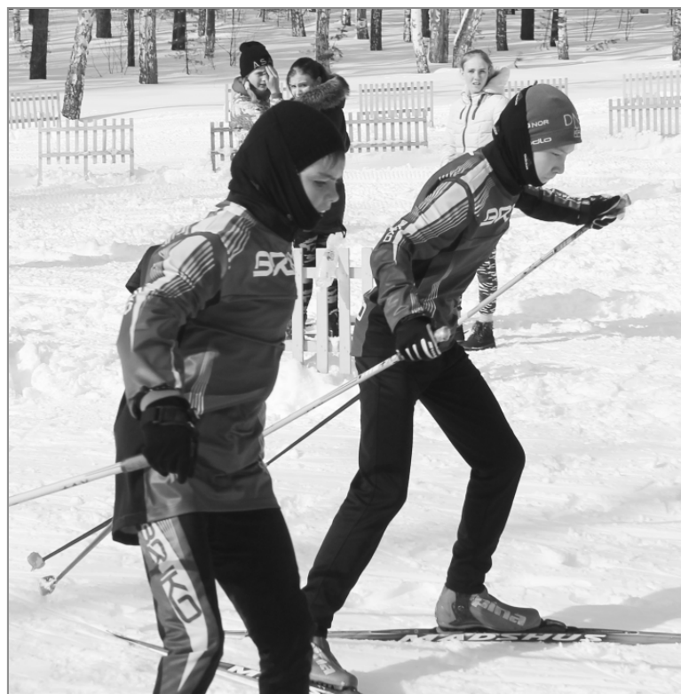
Командная лыжная эстафета проходила на Пионерском озере.