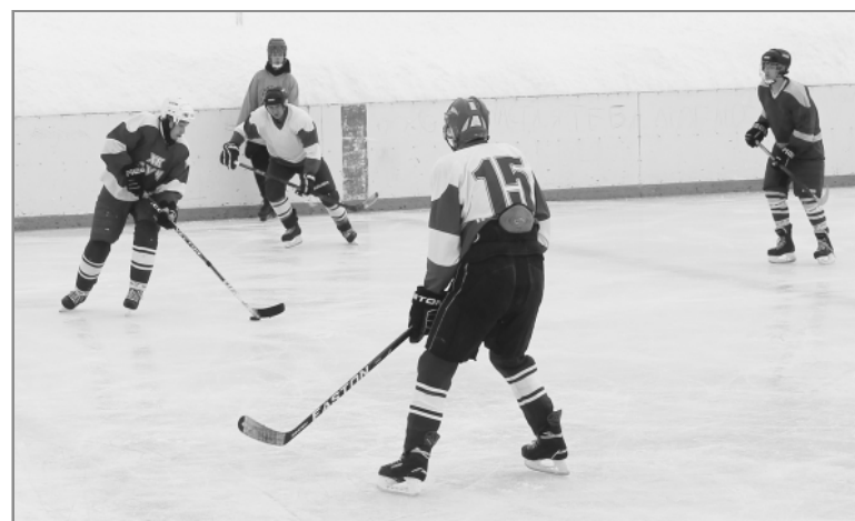
В хоккее играли только две команды — «Факел» и ДЮСШ. Победу в упорной борьбе одержали спортсмены «Факела».