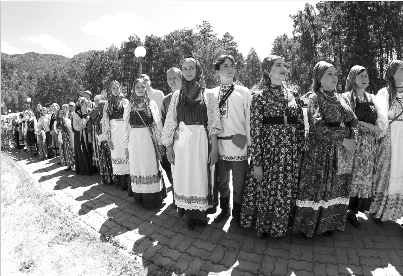
Как будто бы вся Россия собралась на одной поляне. В этом году на фестиваль прибыли артисты из 17-ти регионов нашей страны, всего более четырехсот человек.

Как прошел Всероссийский фестиваль традиционной культуры на «Бирюзовой Катунь»