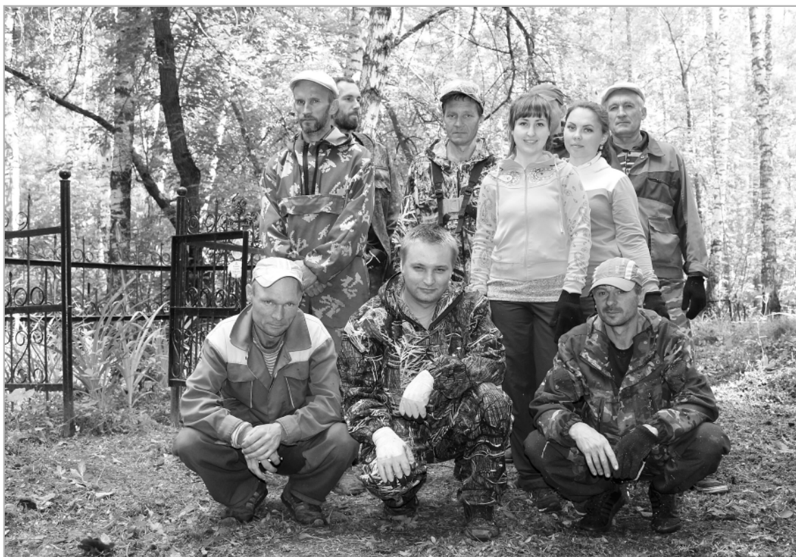
В акции по уборке старого кладбища приняли участие не только работники учреждений, но и неравнодушные жители райцентра.

С 1941 по 1945 год ушли защищать Родину 9500 жителей Троицкого района. 5530 из них погибли смертью храбрых на полях сражений.