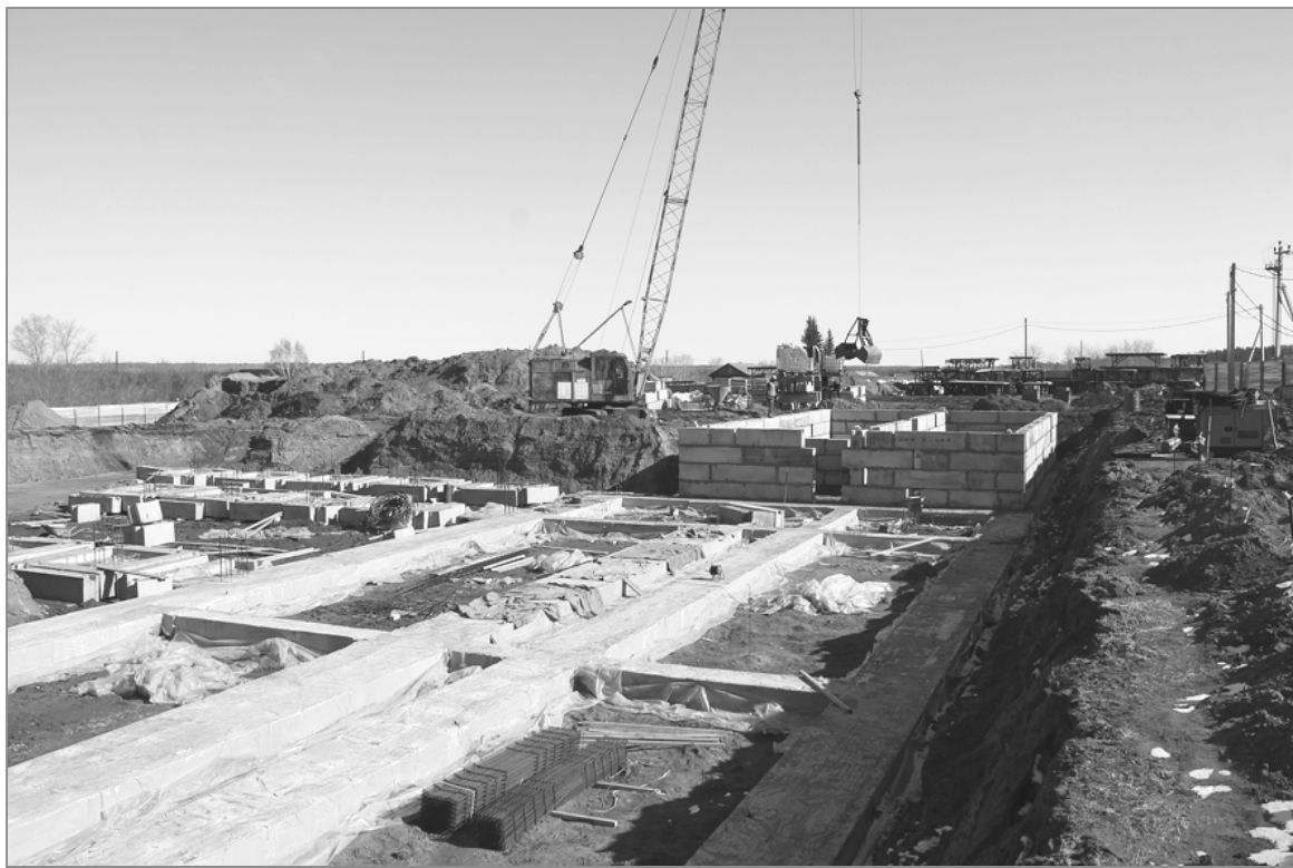
Панорама развернувшегося в селе Заводском строительства.

Главная проблема, с которой мы как подрядчики столкнулись на этом объекте, – это качество подъездных дорог. Даже поставщики строительных материалов высказывали претензии и грозилась, что во второй раз не поедут, поэтому нам иногда приходилось искать других. Если на территории села и на строительной площадке мы можем самостоятельно привести дорогу в порядок, то на подъезде к селу – нет. Арматуру нам поставила фирма «МСВ-1», которая является одним из крупнейших поставщиков края, цемент – из Искитима, фундаментные блоки производит завод «ЖБИ-Сибирь». Цементом и прочими строительными материалами запаслись в необходимом объеме в ожидании того, что федеральные дороги зак-