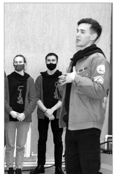
На профориентационном часе для молодежи села Троицкого студенты очень интересно рассказывали об учебе в своих вузах и приглашали поступать к ним учиться.

–Ребята у нас поработали хорошо: очистили от снега памятник погибшим в годы войны, возложили гирлянду, оказали помощь в расчистке домов от снега по двум адресам. Провели игру в спортивном зале сельсовета с нашей во-