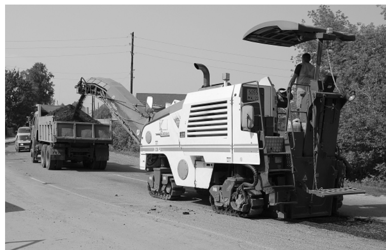
Численность коллектива и материальная база филиала «Троицкий» Северо-Восточного ДСУ позволяют выполнять больший объем дорожных работ.

Кроме того, завезли материалы на автодорогу возле Боровлянки – по селу проложим асфальтобетон-