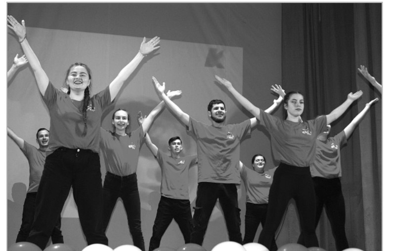
Концертная программа «Стимула» не оставила равнодушным ни одного человека в зрительном зале.