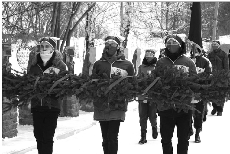
В каждом из сел, где побывал студотряд «Снежного десанта», ребята почтили память погибших в годы Великой Отечественной войны и возложили гирлянды к памятникам. На снимке: возложение гирлянды в райцентре.