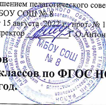
Таблица-сетка часов учебного плана МБОУ СОШ №8, для 2-4-х классов по ФГОС НОО на 2022 – 2023 учебный год.