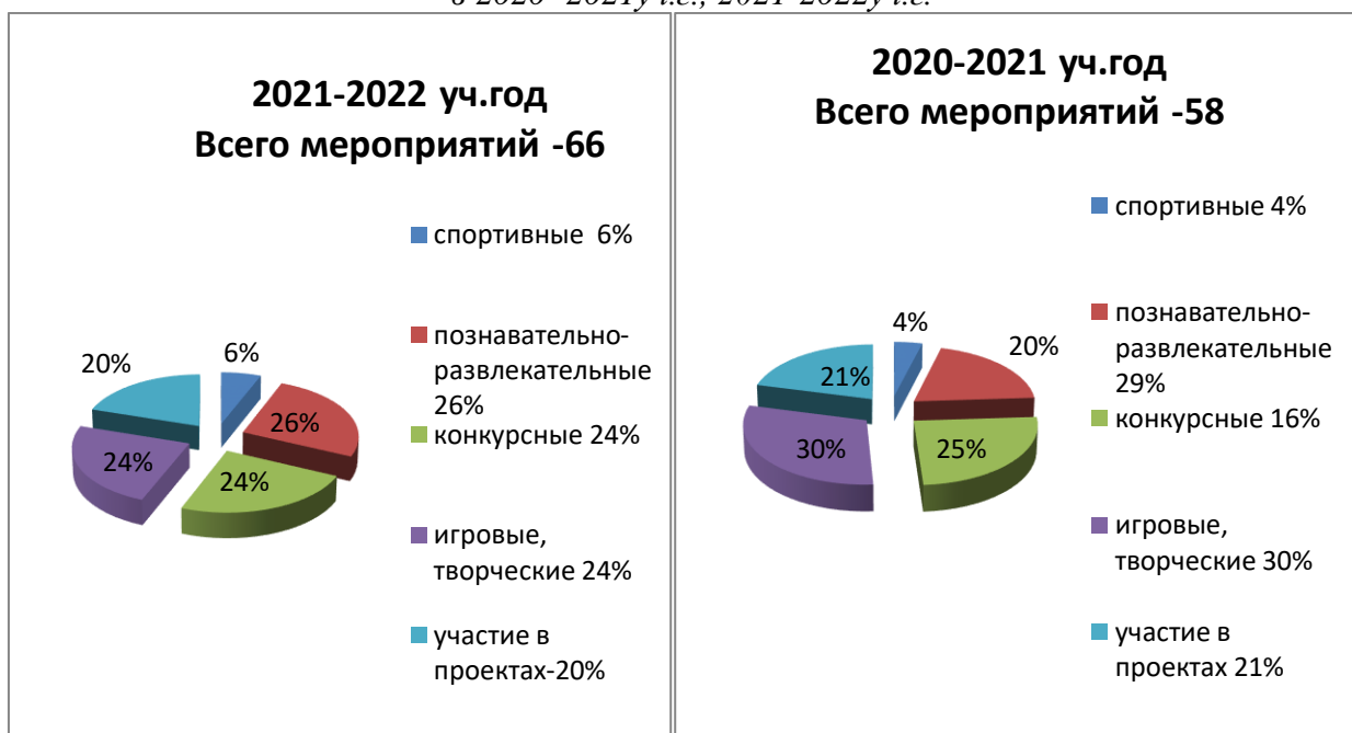
Сравнительный анализ направленности проведенных мероприятий, в 2020 -2021уч.г., 2021-2022уч.г.

Сравнительный анализ показал, что в 2021-2022 учебном году увеличилось количество проведенных мероприятий, уменьшилось количество познавательно-развлекательных мероприятий и увеличилось количество мероприятий спортивной направленности и конкурсных мероприятий.