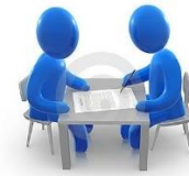
Личное обращение в ведомство