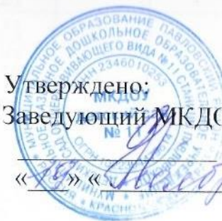
График отпусков сотрудников МКДОУ детский сад № 11 на 2021 г.