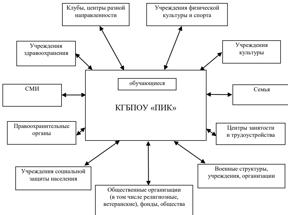
Структура взаимодействия учреждений образования с другими учреждениями и организациями институционального и неинституционального уровней

Образовательное учреждение, педагогический коллектив которого стремится к своему становлению как открытой социально-педагогической системы, остается тем важнейшим социальным институтом, который обеспечивает реальное взаимодействие растущей личности, родителей и социума.