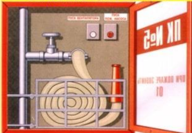
ВНУТРЕННИЙ ПОЖАРНЫЙ КРАН

Предназначен для тушения пожаров водой от внутреннего водопровода жилых, административных и производственных помещений (кроме электроустановок под напряжением). -высота шкафа от пола-1,35м, ствол, кран должны соединены; -внешний осмотр кранов - 2 раза в год; -проверка спуска воды-один раз в г., подтекать, недопустимо; -льняной рукав перематывают складку-один раз в 6 месяцев