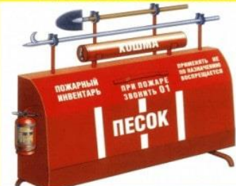
ЩИТЫ ПОЖАРНЫЕ С ПЕСКОМ

Предназначены для размещения и хранения огнетушителей пожарного инструмента и инвентаря, применяемых для ликвидации пожаров в организациях, на объектах экономики, в складских помещениях и заправочных пунктах - устанавливаются как правило на улице. Использовать пожарное оборудование для нужд не связанных с пожаротушением ЗАПРЕЩАЕТСЯ!