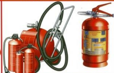
ПОРШКОВЫЕ И ВОДНЫЕ

1. Применяется, в зависимости от состава порошка, для тушения пожаров класса А, Б, С, Е-установок под напряжением до 1000 В и класса Д. 2. Применяется для тушения пожаров класса А, на небольших площадях (не применять для тушения горящих жидкостей, газов и электроустановок).