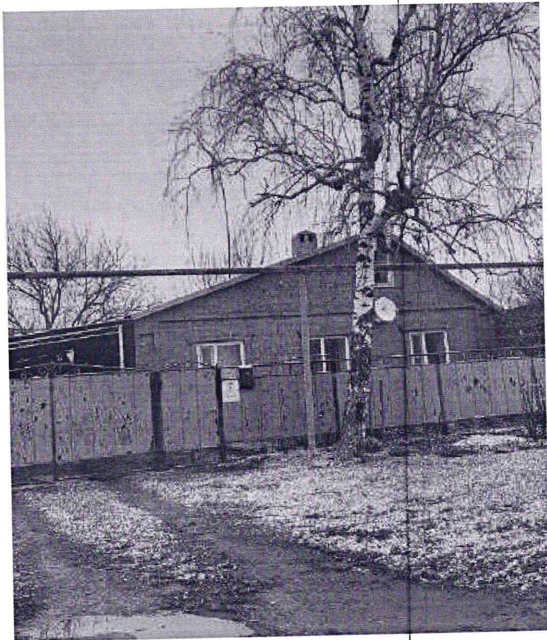
Φοτο Νο 3