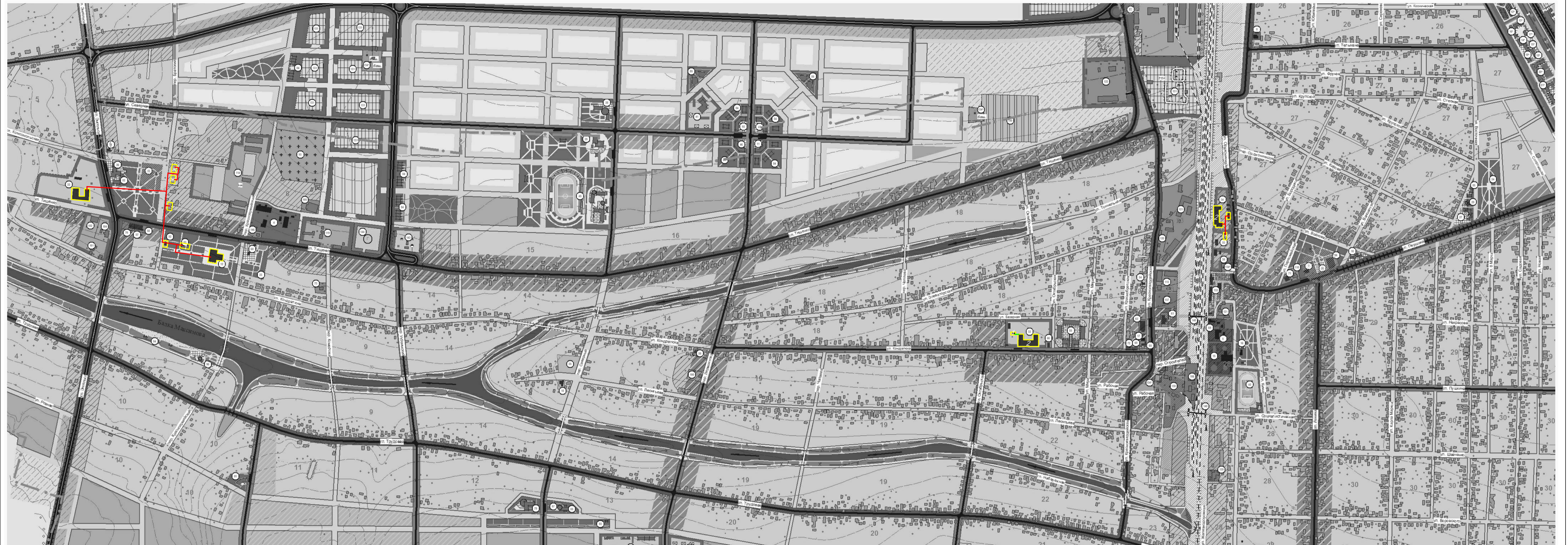
СХЕМА ТЕПЛОСНАБЖЕНИЯ ст. ОКТЯБРЬСКАЯ