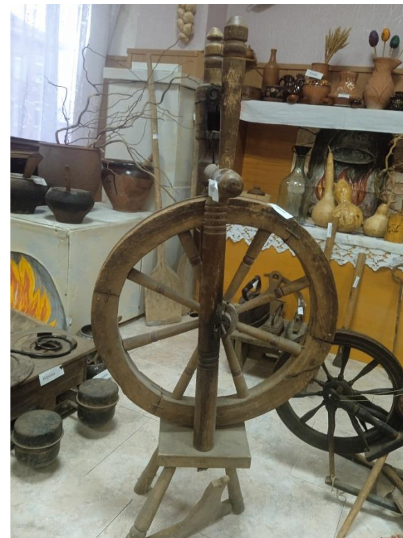
Фото из школьного историко – краеведческого музея МБОУ СОШ № 6 им. И.Т. Сидоренко