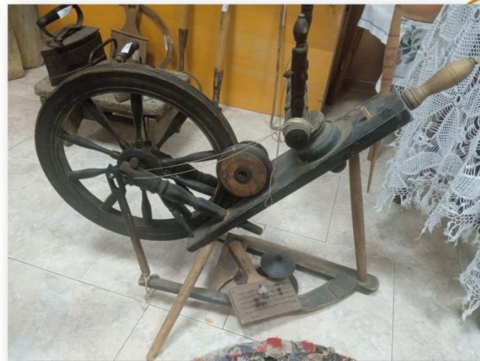
Фото из школьного историко – краеведческого музея МБОУ СОШ № 6 им. И.Т. Сидоренко