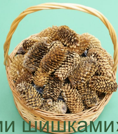
«Корзина с еловыми шишками»