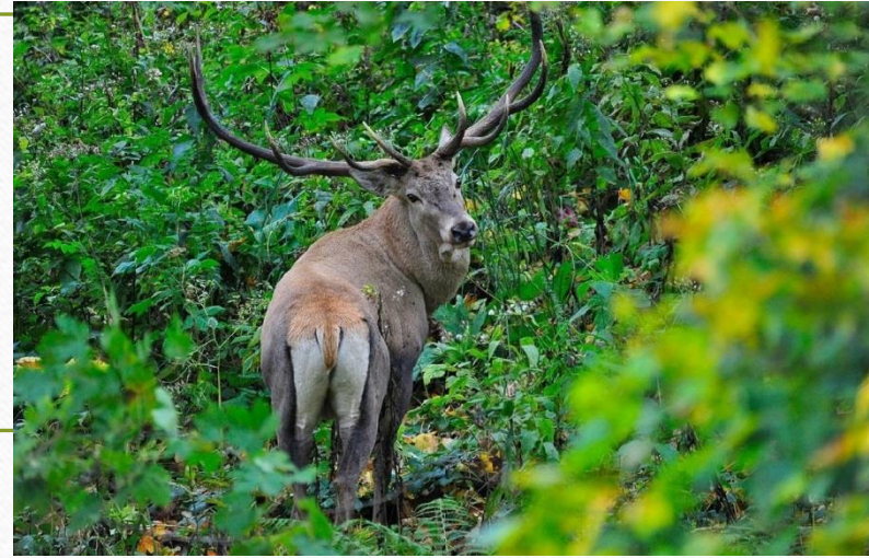
Кавказский благородный олень