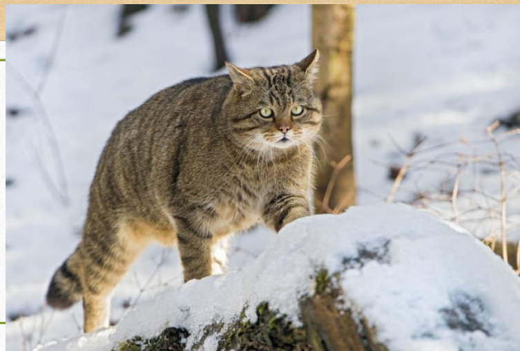
Кавказский лесной кот