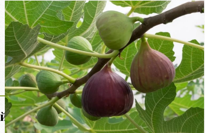
и инжир карийский