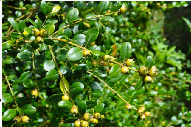
и лептопус колхидский,

а также Тис ягодный – вечно зеленое, хвойное растение способное дожить до 2, а то и 2,5 тысяч лет.