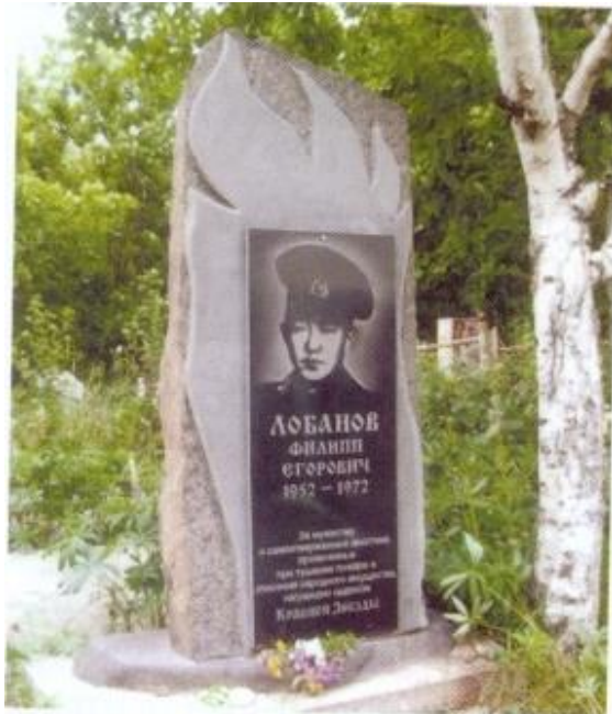
На могиле воина. Село Стародубское. 2008 год