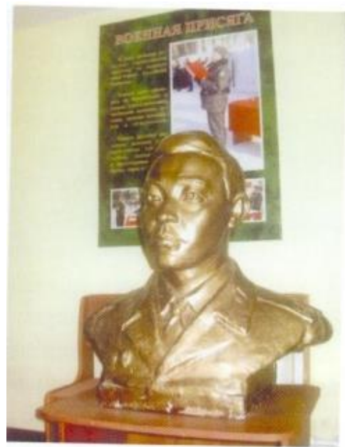
Бюст Филиппа Лобанова. Батальон армейской милиции. Южно-Сахалинск. 2008 год