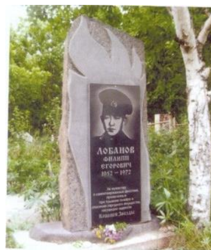
На могиле воина. Село Стародубское. 2008 год