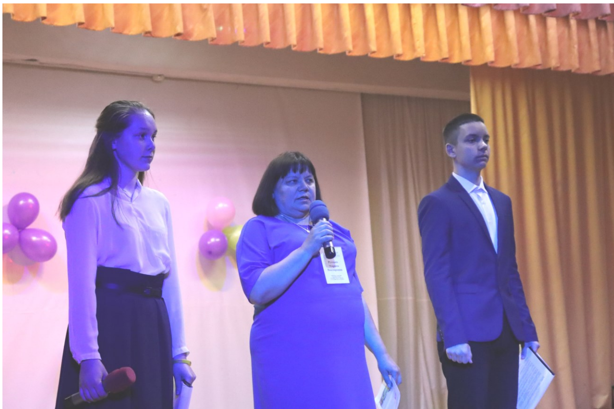
Участников приветствовала танцевальная студия «Кураж».