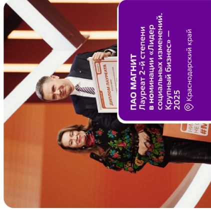
ПАО МАГНИТ Лауреат 2-й степени в номинации «Лидер социальных изменений. Крупный бизнес» — 2025 📍 Краснодарский край

присуждается за значимые проекты, реализуемые малыми, средними и социальными предпринимателями