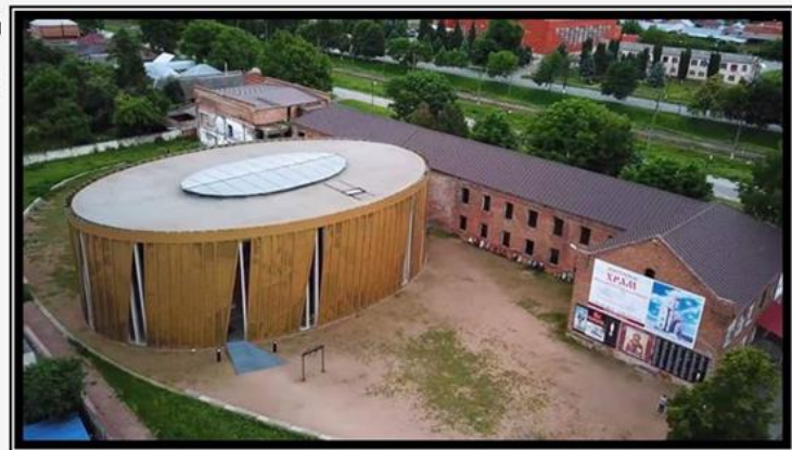
Золотой круглый саргофаг накрывает спортзал