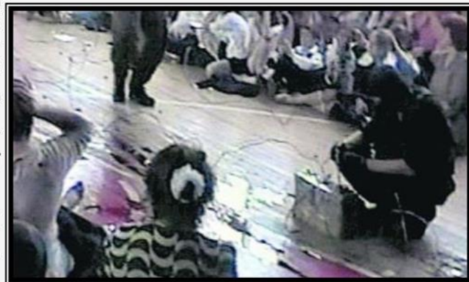
Террористы заминировали всю школу

Большинство заложников были согнаны в спортивный зал. Заставили всех сдать фото- и видеоаппаратуру, а также мобильные телефоны, которые разбивали. Снаружи школы были установлены камеры видеонаблюдения, а из «ГАЗ-66» были выгружены боеприпасы, тяжёлое вооружение и взрывчатка. Террористы забаррикадировали окна спортзала и входные двери, заминировали сам зал.