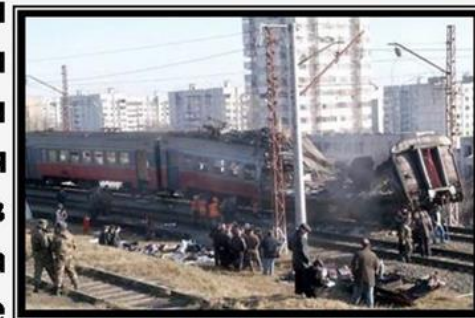
5 декабря 2003 теракт Ессентуки

Следующий 2004 год стал пиком терроризма: в течение нескольких месяцев бандиты успели дважды подорвать московское метро, а также смертницы взорвали два пассажирских самолёта, атаковали Ингушетию и совершили несколько эффектных вылазок в самой Чечне. Эти теракты преследовали двойные цели: во-первых, запугать российский народ и лишить его воли к сопротивлению; во-вторых, разжечь пламя войны в соседних регионах. Именно ради этой цели Басаев и разработал теракт с захватом школы. Согласитесь, сложно придумать что-либо подлее, чем расправа с маленькими детьми.