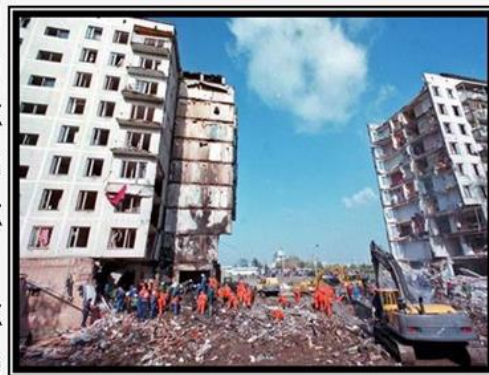
9 и 13 сентября 1999 года: взрывы жилых домов на улице Гурьянова и на Каширском шоссе.