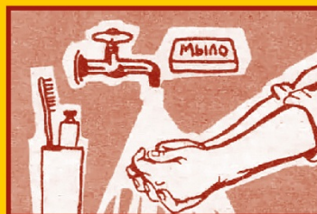
Регулярно мойте руки