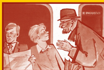
Ограничьте пребывание в местах скопления людей