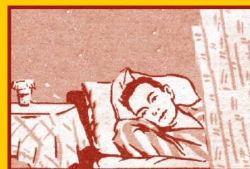
Избегайте контактов с заболевшими