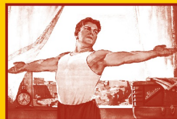
Ведите здоровый образ жизни