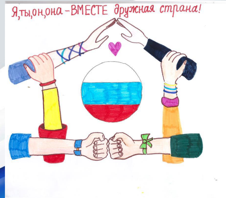
Мельников Саша, подготовительная № 2