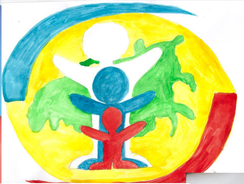
Кондратенко Ульяна, подготовительная № 3