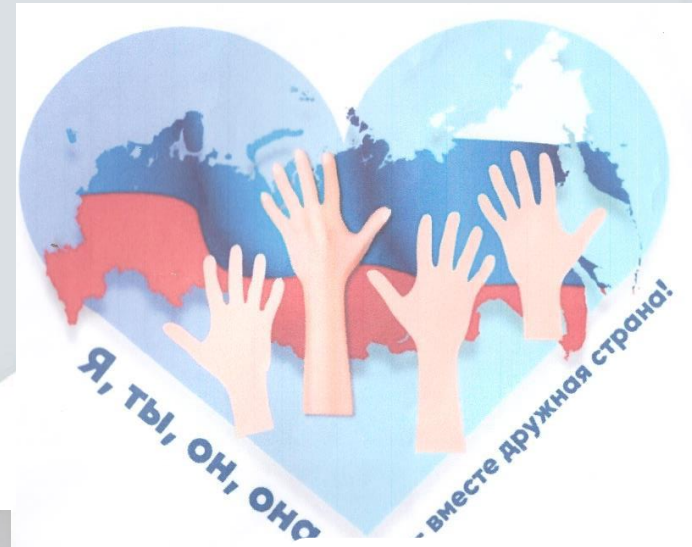
Подготовительная № 3