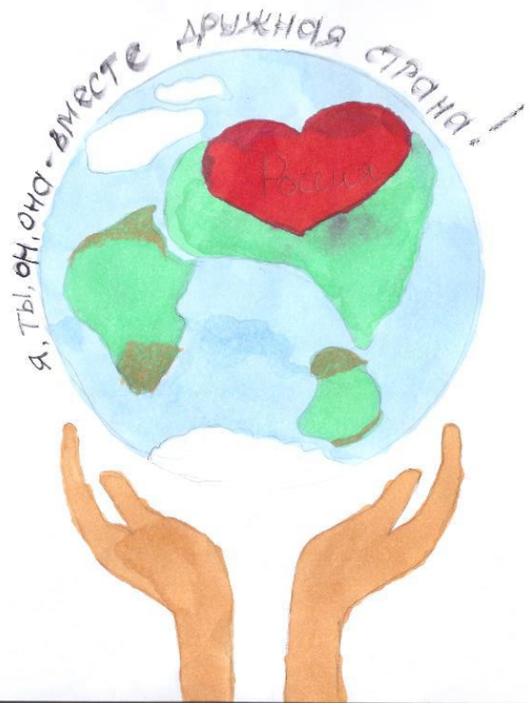
Котова Дарья, подготовительная № 2