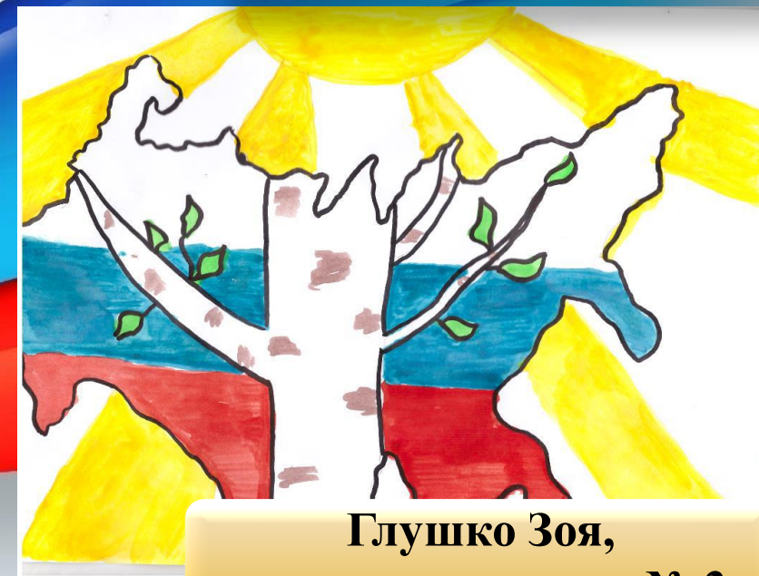
Глушко Зоя, подготовительная № 3