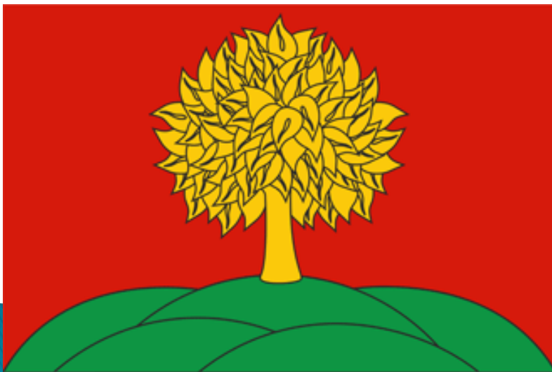
Флаг Липецкой области