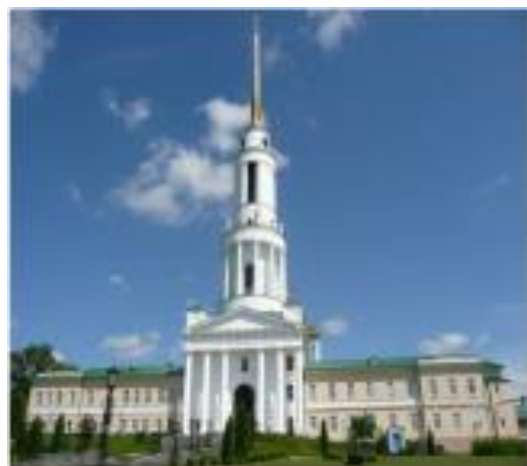
Колокольня с церковью Николая Чудотворца