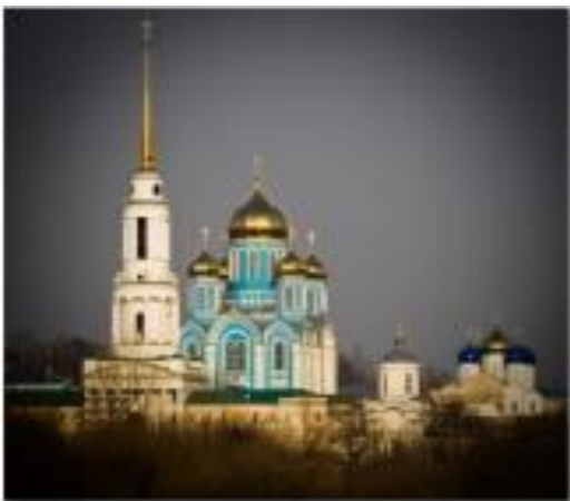
Рождество-Богородицкий мужской монастырь