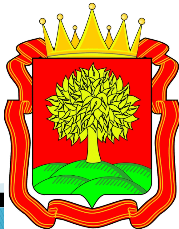
Герб Липецкой области