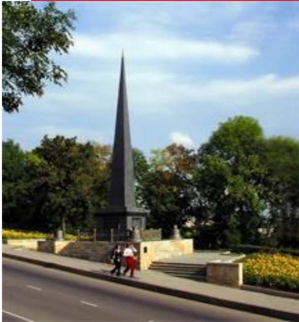
Обелиск Петру I на Петровском спуске