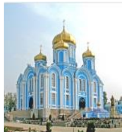
Собор Владимирской иконы Божьей матери