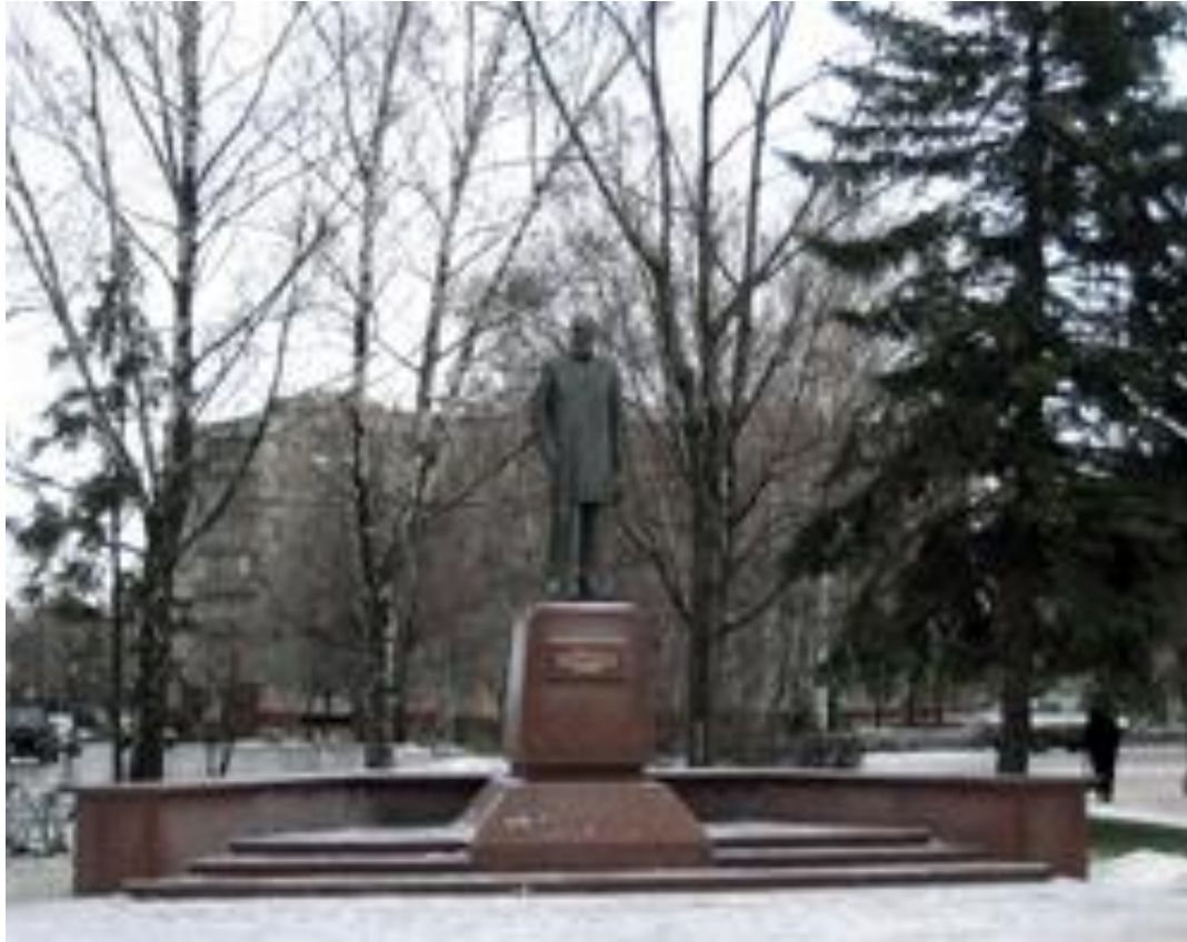
Памятник М.А. Ключеву