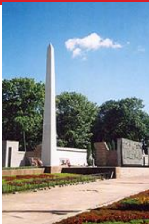
Обелиск Вечной славы на площади Героев

17 июня 1972 г. в Нижнем парке был открыт мемориальный памятник «Народовольцам», посвященный 100-летнему юбилею со дня их съезда в Липецке.