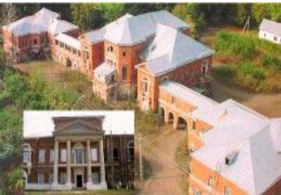
Усадьба Нечаевых- Мальцевых