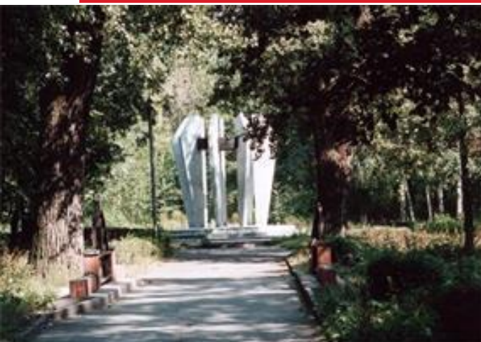
Мемориальный памятник Народовольцам

17 июня 1972 г. в Нижнем парке был открыт мемориальный памятник «Народовольцам», посвященный 100-летнему юбилею со дня их съезда в Липецке.