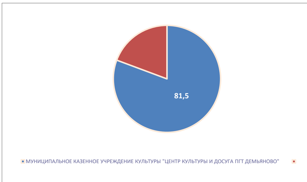
Рисунок 1 – Интегральный показатель по критерию «Открытость и доступность информации об организации культуры»

По первому критерию «Открытость и доступность информации об организации культуры» МУНИЦИПАЛЬНОЕ КАЗЕННОЕ УЧРЕЖДЕНИЕ КУЛЬТУРЫ "ЦЕНТР КУЛЬТУРЫ И ДОСУГА ПГТ ДЕМЬЯНОВО" набрало 81,5 балла (Рис.1).