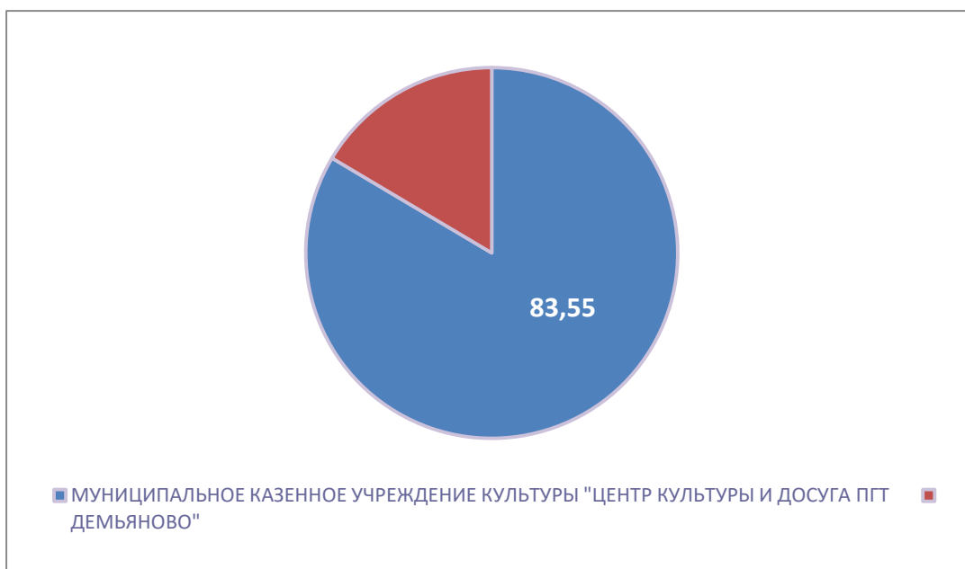
Рисунок 4 – Интегральный показатель по критерию «Доброжелательность, вежливость работников организации»

По четвертому критерию «Доброжелательность, вежливость работников организации» МУНИЦИПАЛЬНОЕ КАЗЕННОЕ УЧРЕЖДЕНИЕ КУЛЬТУРЫ "ЦЕНТР КУЛЬТУРЫ И ДОСУГА ПГТ ДЕМЬЯНОВО" набрало 83,55 балла (Рис. 4).