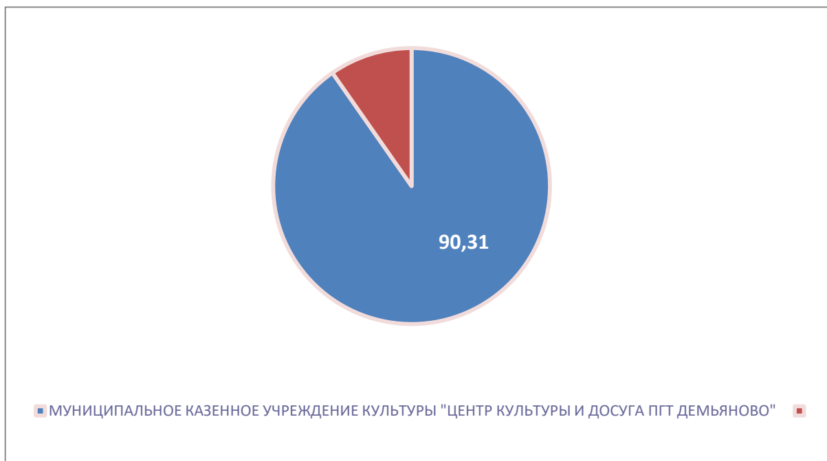
Рисунок 2 – Интегральный показатель по критерию «Комфортность условий предоставления услуг»

По второму критерию «Комфортность условий предоставления услуг» МУНИЦИПАЛЬНОЕ КАЗЕННОЕ УЧРЕЖДЕНИЕ КУЛЬТУРЫ "ЦЕНТР КУЛЬТУРЫ И ДОСУГА ПГТ ДЕМЬЯНОВО" набрало 90,31 балла (Рис.2).