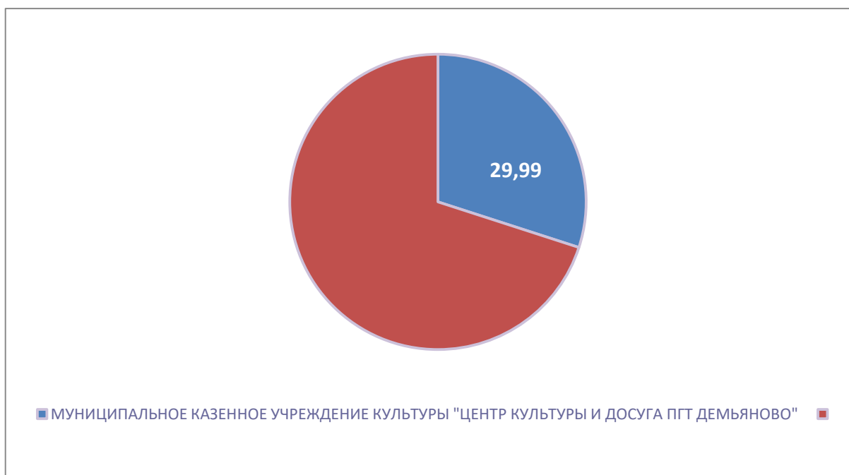
Рисунок 3 – Интегральный показатель по критерию «Доступность услуг для инвалидов»

По третьему критерию «Доступность услуг для инвалидов» МУНИЦИПАЛЬНОЕ КАЗЕННОЕ УЧРЕЖДЕНИЕ КУЛЬТУРЫ "ЦЕНТР КУЛЬТУРЫ И ДОСУГА ПГТ ДЕМЬЯНОВО" набрало 29,99 балла (Рис.3).