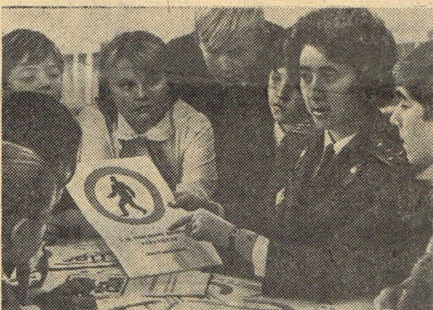
ПСКОВ. Отряды юных инспекторов движения организованы в 20 школах Пскова. 500 пионеров шестых-седьмых классов под руководством работников ГАИ областного управления внутренних дел изучают правила уличного движения и поведения пешеходов, дорожные знаки, вместе с сотрудниками ГАИ участвуют в рейдах.

Действительно, подобные безобразия недопустимы. Но пора пресечь и нарушения со стороны руководителей деревообрабатывающего цеха завода ЖБИ. Несмотря на неоднократные предупреждения, заводские отходы производства часто высыпаются у обочины дороги.