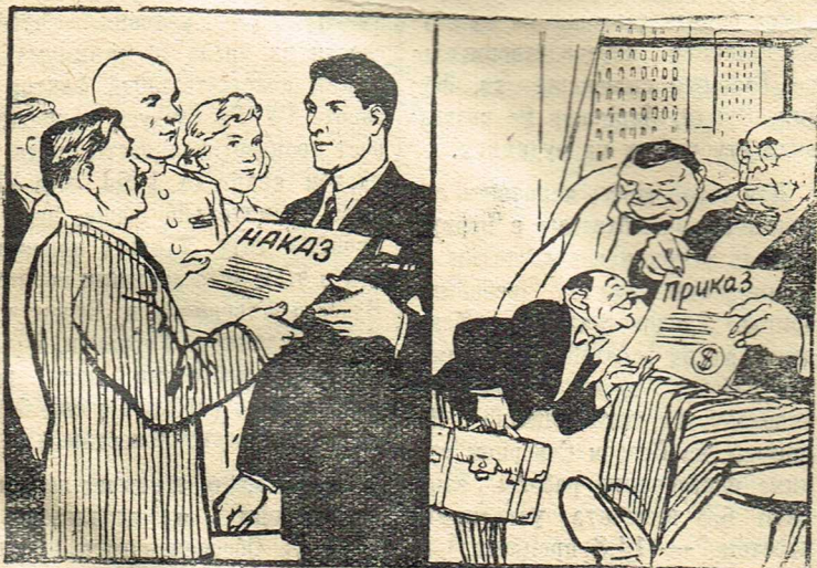
Депутат — слуга народа. Депутат — слуга господ.