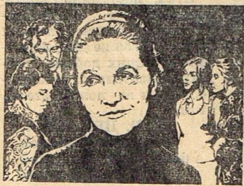
ДОЧКИ — МАТЕРИ

Фильмы народного артиста СССР известного кинорежиссера, профессора Всесоюзного Государственного института кинематографии Сергея Герасимова памятные и любимые зрителям разных поколений. Это «Молодая гвардия», «Семеро смелых», «Тихий Дон», «Люди и звери», «У озера», «Любить человека» и многие другие.