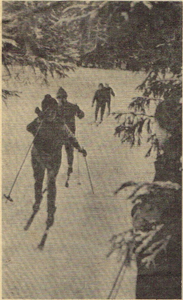
В воскресный день.