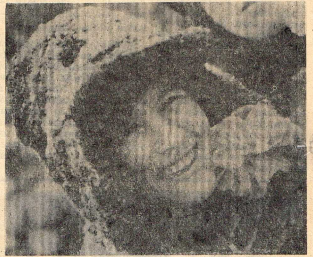
Редактор В. И. СЕМЕНЦОВ.