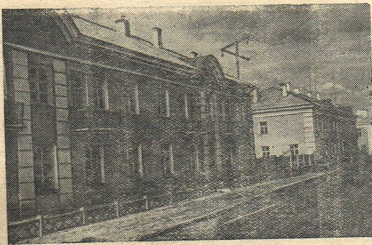
Растет и хорошеет город крылатой руды — Североуральск. Возводятся благоустроенные дома, асфальтируются тротуары и дороги.

На снимке: одна из новых улиц в районе будущего центра города.