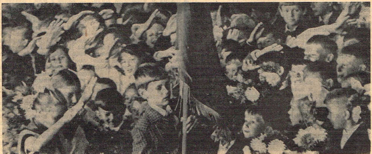
Торжественная линейка в школе № 7.

Ф. РЯБКОВ, старший нормировщик шахты № 16-16 бис.