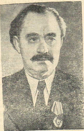
Г. М. Димитров

Пять лет назад, 2 июля 1949 года, умер Георгий Михайлович Димитров, выдающийся деятель международного рабочего движения, вождь Болгарской коммунистической партии и болгарского народа, верный друг Советского Союза. Родился в 1882 году.