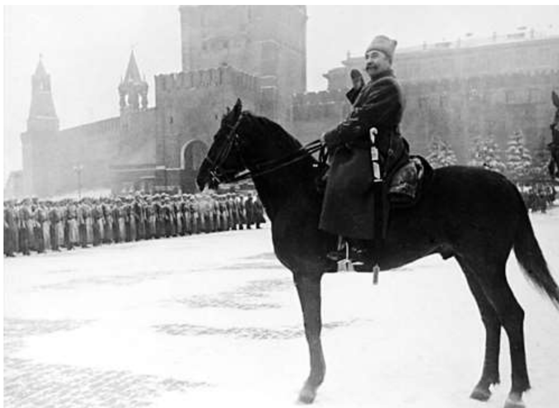
Москва, 7 ноября 1941 г., Красная площадь.

Интересна, богата событиями жизнь героя. Достойную жизнь прожили и дети, и внуки С.М.Будённого, среди которых много творческих людей. «Мы, русские солдаты, воевали за Отечество, за Россию, за народ», - говорил Будённый, родившийся в семье батрака, работавший мальчиком у купца, помощником кузнеца, молотобойцем, кочегаром, машинистом на молотилке и ставший маршалом великой страны.