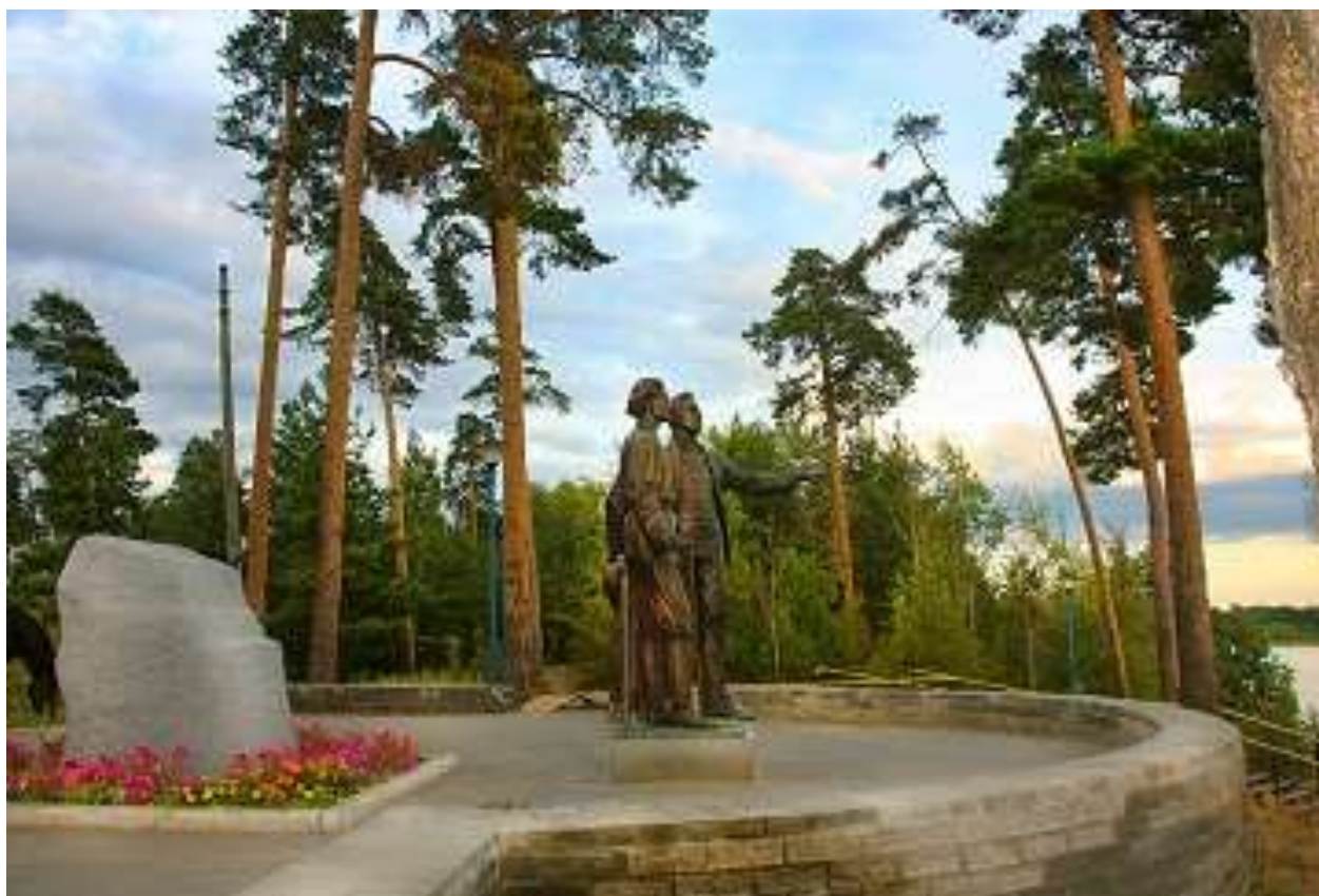
Памятник Горькому и Шаляпину на Моховых горах в Борском районе Нижегородской области

Фёдор Иванович Шаляпин прошел похожий с Горьким жизненный путь: с 9 лет работал и при этом стремился к образованию, читал книги, самостоятельно учился играть на скрипке, пел в церковном хоре. Судьба его переплеталась с судьбой Максима Горького (еще до их знакомства) в разных городах: Казани, Уфе, Тифлисе. Двух творцов сближало многое: служение искусству, любовь к Родине, близость к народу. Оба вышли из низов, пробивая дорогу своим трудом с раннего детства. В 1900 году они познакомились. Максим Горький тогда поприветствовал Фёдора Шаляпина словами: "Я знаю историю твоей жизни... Мы братья". Эта дружба продолжалась более 30 лет.