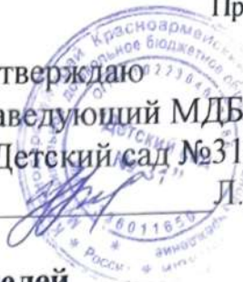
График работы воспитателей МДБОУ «Детский сад №31»