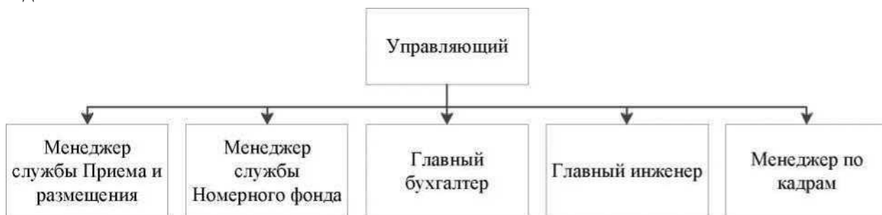
Рисунок 1.3 - Организационная структура ООО «Гостиница», 2020 г.

При ссылках на иллюстрации следует писать «... в соответствии с рисунком 2» при сквозной нумерации и «... в соответствии с рисунком 1.2» при нумерации рисунка в пределах раздела.