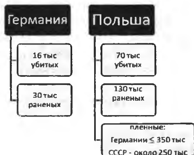
Схема 2. Потери за время германо-польской войны:

Общее состояние польских войск оказалось катастрофическим, погибло около 70 воинов, приблизительно 140 тыс. было ранено, в германский плен попало более 350 тыс. человек (из них 40 тыс. назвались белорусами). Значительные потери понесла и Германия – более 16 тыс. раненых и около 30 тыс. убитых (см. схему 2). В результате больших потерь германских вооружённых сил начало наступления на Францию было надолго задержано.