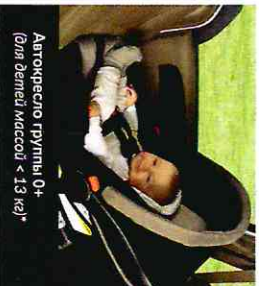
Автокресло группы 0+ (для детей массой < 13 кг)*