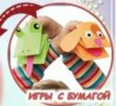
ИГРЫ С БУМАГОЙ