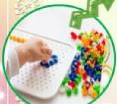
ИГРЫ С МОЗАИКОЙ