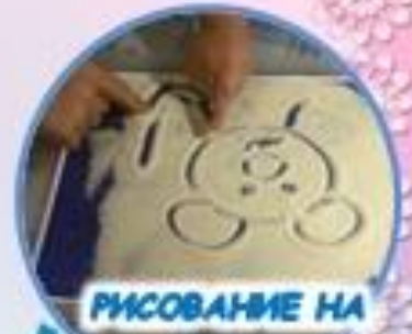
РИСОВАНИЕ НА ПЕСКЕ ИЛИ МАНКЕ