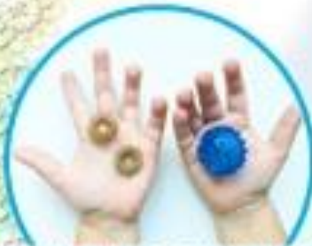
УПРАЖНЕНИЯ С ШАРИКОМ И КОЛЬЦАМИ «СУ - ДРОК»