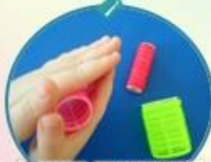
ИГРЫ С БИГУДАМИ