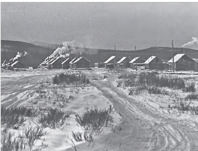
ПОСЁЛОК ПЕРЕВАЛ - ХОЛОДНИНСКАЯ ГЕОЛОГО-РАЗВЕДОЧНАЯ ПАРТИЯ

За советский период работы (1958-1991 г.г.) коллективом экспедиции были покрыта среднемасштабной съёмкой (1:50 000) вся территория Северо-Байкальского района, дана