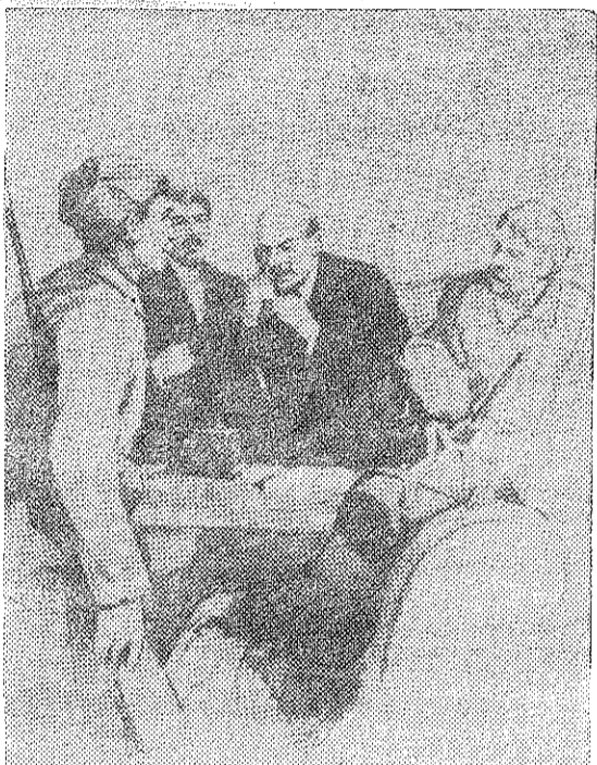
В. И. Ленин у телефона в Смольном (рисунок художника П. Васильева).