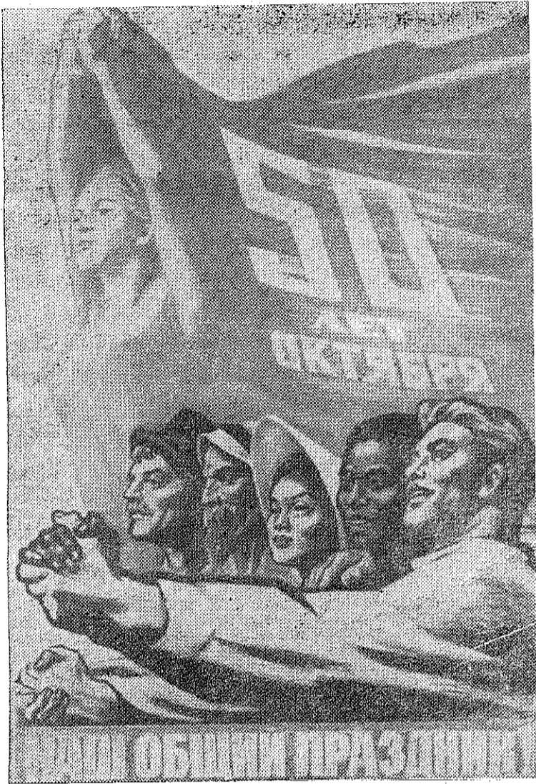
Плакат художника И. Тойдза, выпущенный издательством «Советский художник» в 50-летие Великого Октября.