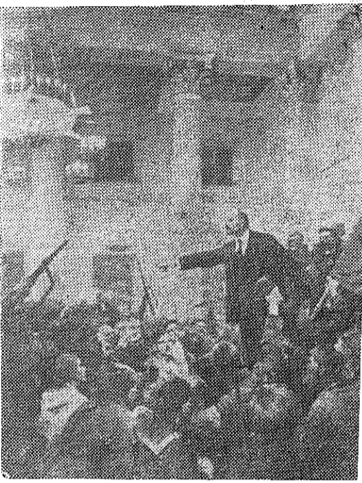
В. И. Ленин провозглашает Советскую власть (с картины художника В. Серова).