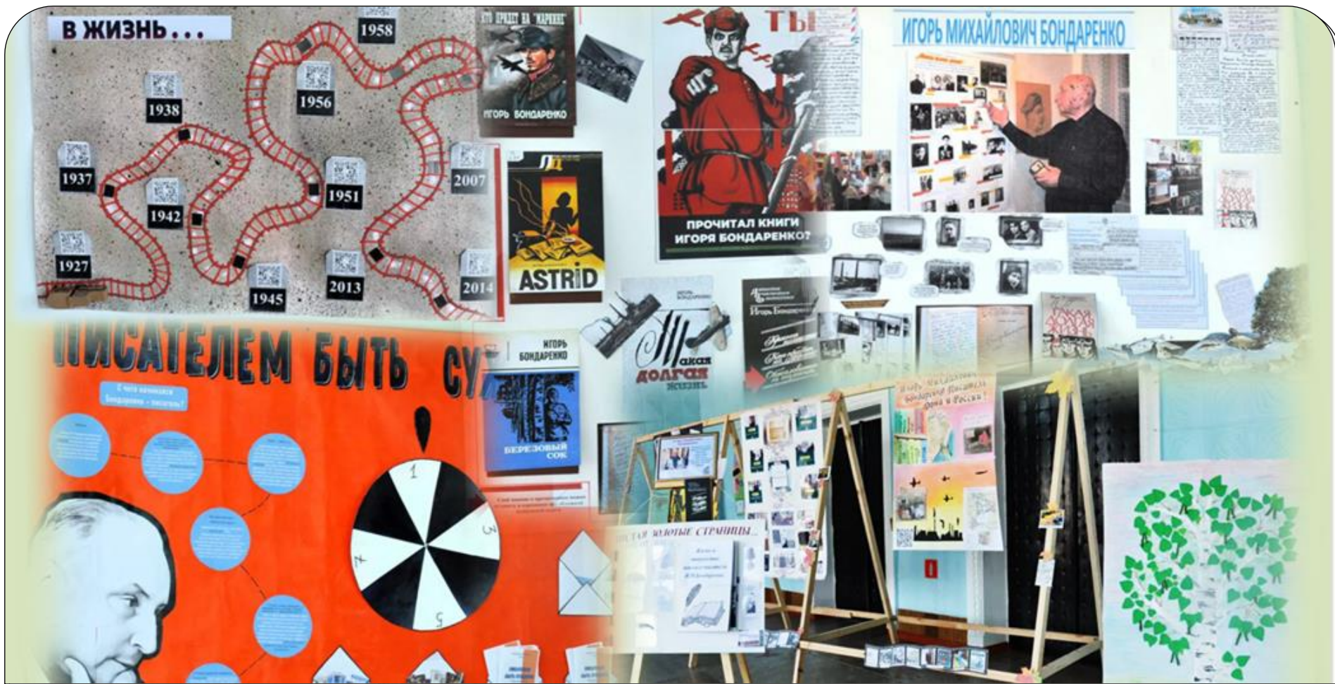
Смотр-конкурс интерактивных плакатов «Открой свою книгу» октябрь 2023 г.