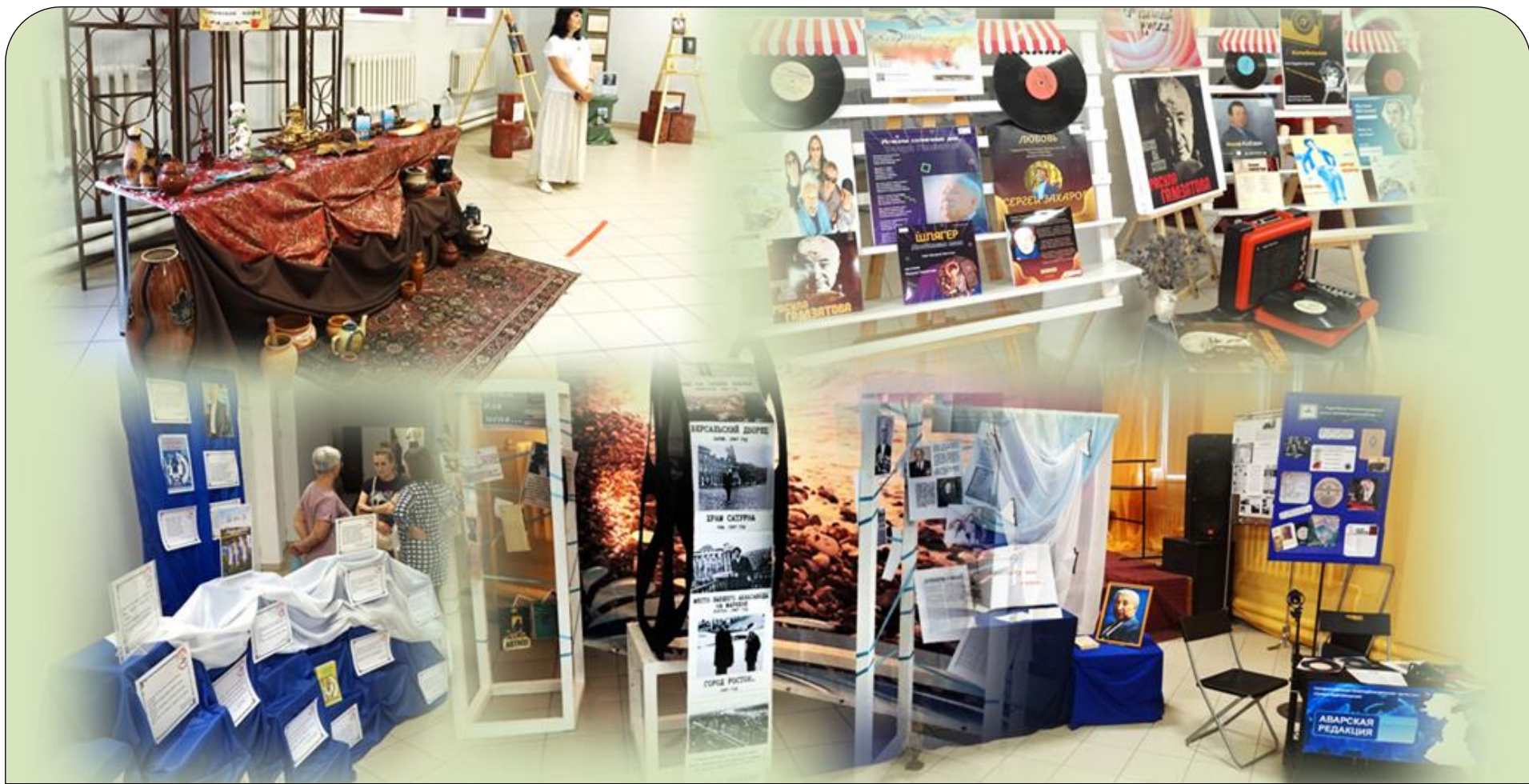
Малая литературная аллея «В семье народов России» июль 2023 г.