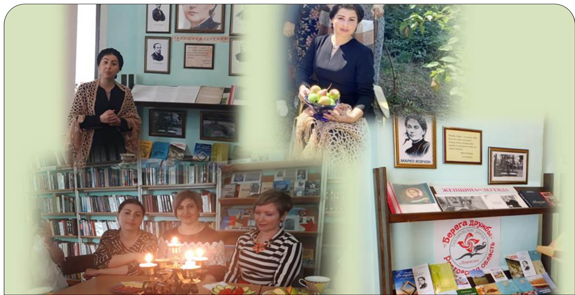
Экскурсия в Краснодесантской библиотеке им. Марко Вовчок.