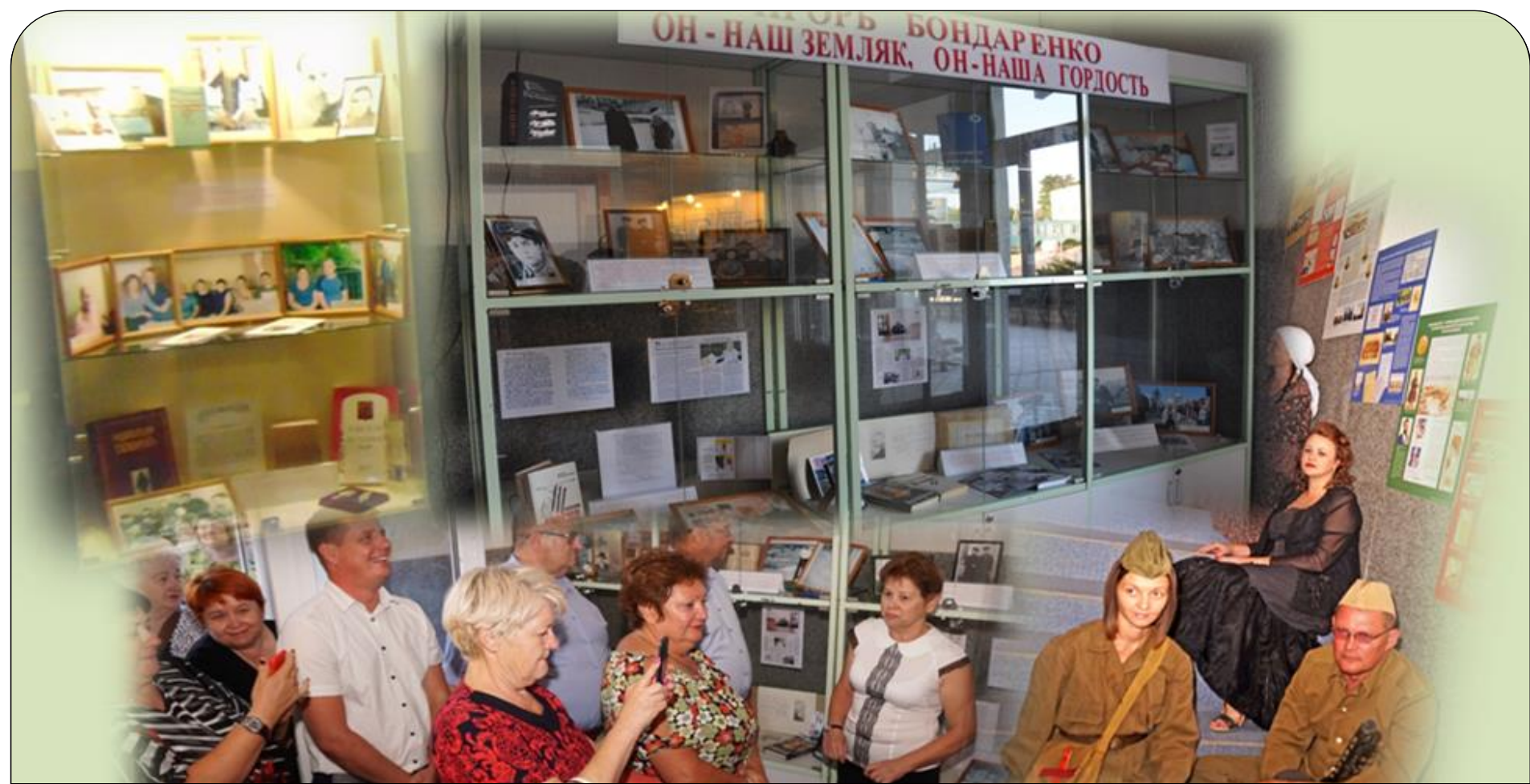
Выставка-инсталляция «Он – наш земляк, он – наша гордость» в центральной библиотеке, посвященная жизни и творчеству Игоря Бондаренко