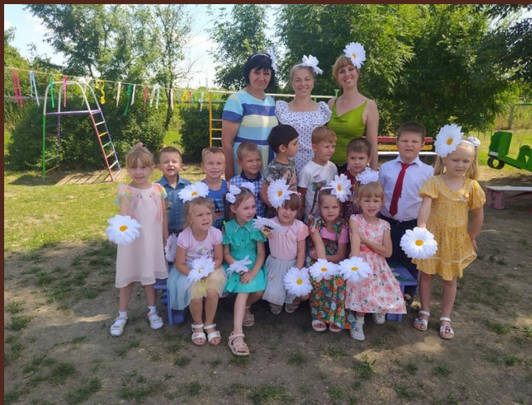
День семьи, любви и верности (день Петра и Февронии)

Русские народные традиции открывают огромные возможности для детей, давая и знания и опыт организации и само регуляции своей деятельности, помогают выработать способность управлять собственными действиями, переживаниями и состояниями, поступками в соответствии с интересами других людей, требованиями общественного долга. К народным традициям относятся праздники, обряды, обычаи, игры. В качестве основных средств воспитания в нашем детском саду педагоги используют все компоненты народной культуры: фольклор, песни, сказки, пословицы, загадки, поговорки, праздники.