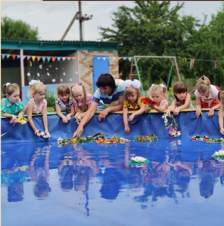
Праздник «Ивана Купалы»

Слово «традиция» - означает исторически сложившиеся и передаваемые из поколения в поколение обычаи, порядки, правила поведения. В качестве традиции выступают определенные общественные установки, нормы поведения, ценности, идеи, обычаи, обряды, праздники и т.д. Русские народные традиции - одна из составленных частей культурного наследия русского народа.