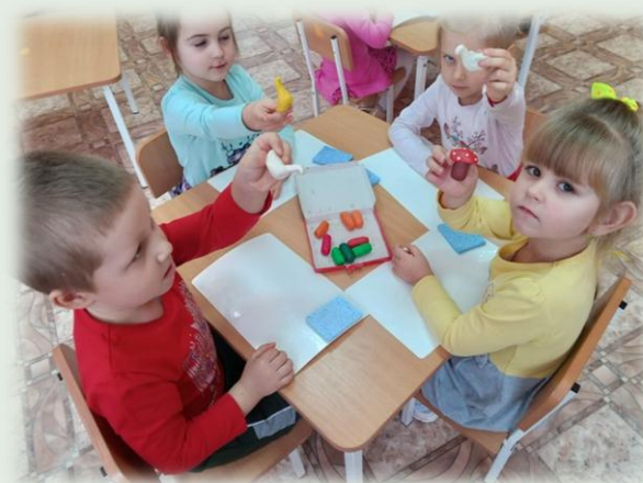
Лепка из пластилина