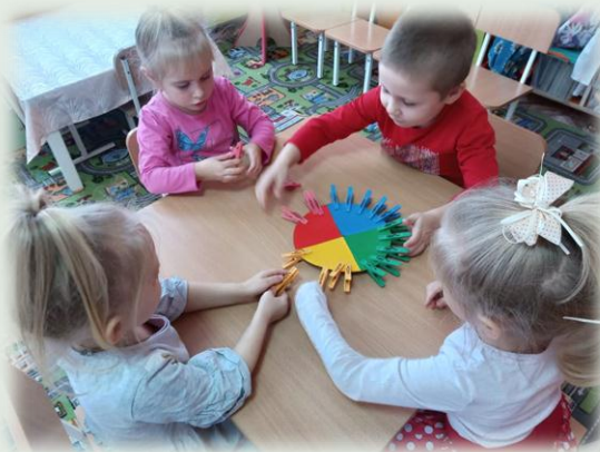
Игра с прищепками