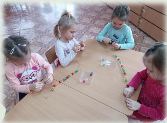
Игра с бусами