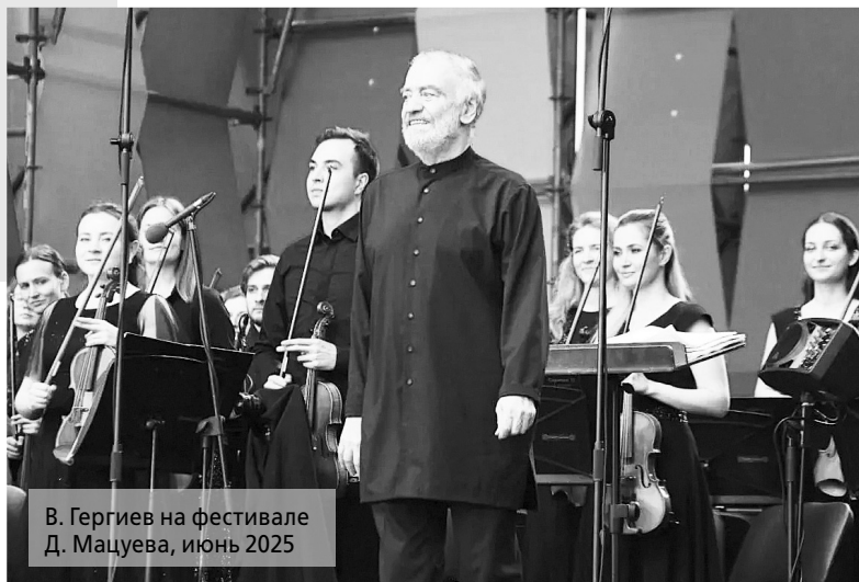
В. Гergieв на фестивале Д. Мацуева, июнь 2025

В рамках подготовки к празднованию 60-летия легендарного турмаршрута «Золотое кольцо России» (юбилей будет отмечаться в 2027 году) готовятся новые маршруты-спутники, в т.ч. по Боголюбово, Гусь-Хрустальному, Мурому, Мстёре и Гороховцу. Также в качестве вариантов посещения для гостей будет предложен пешеходный маршрут по национальному парку «Мещёра».