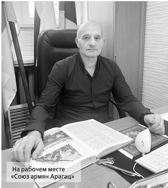
На рабочем месте «Союз армян Арагац»