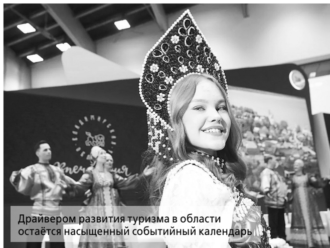
Драйвером развития туризма в области остаётся насыщенный событийный календарь