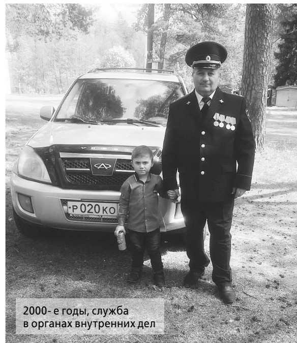
2000-е годы, служба в органах внутренних дел

Кроме культурных проектов, «Арагац» помогает участникам СВО. «Мы собираем гуманитарную помощь, передаём че-