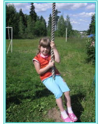
Спортивная игра «Зов Джунглей»

Большую работу проводит спортивный сектор детского школьного объединения «Семейный Совет» по пропаганде здорового образа жизни. Организуют свою работу через статьи в школьной газете, спортивные праздники, создает уголок спортивной славы школы, помещает фото лучших спортсменов. Наряду с этим лекторская группа организует беседы на темы о значении физической культуры, правилах гигиены, режимах питания, медицинского работника школы.