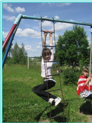
Спортивная игра «Зов Джунглей»

Такая организация работа наиболее полно обеспечивает массовость физической культуры и спорта, почти все учащиеся в той или иной мере охвачены и