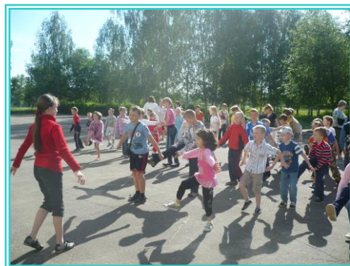
Утренняя зарядка в 3,4,5 классах.

Спортивный сектор детского школьного объединения «Семейный Совет» помогает руководству школы, классным руководителям и учителям физической культуры в организации физкультурно-оздоровительных мероприятий