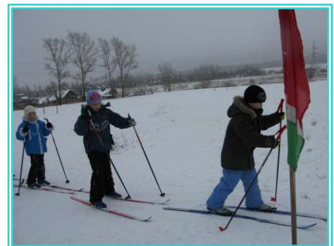
Общешкольная лыжная гонка

Наряду со спортивными секциями в школе создаются группы по общей физической подготовке (ОФП). В