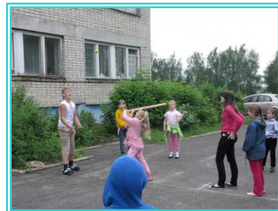
Спортивные игры на большой перемене

физкультурных минут на уроках, подвижные перемены).