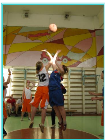
Школьная мини-спартакиада по баскетболу

Школьники лучше осваивают теоретический материал программы, когда при прохождении соответствующего вида движений опираются на знания из области математики, физики, биологии.