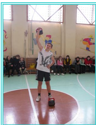
Спортивный праздник «А ну-ка, парни!»

школьников и осуществляется в группах лечебной физической культуры (ЛФК). Занятия в группах (ЛФК) проводятся на базе ДЮСШ.