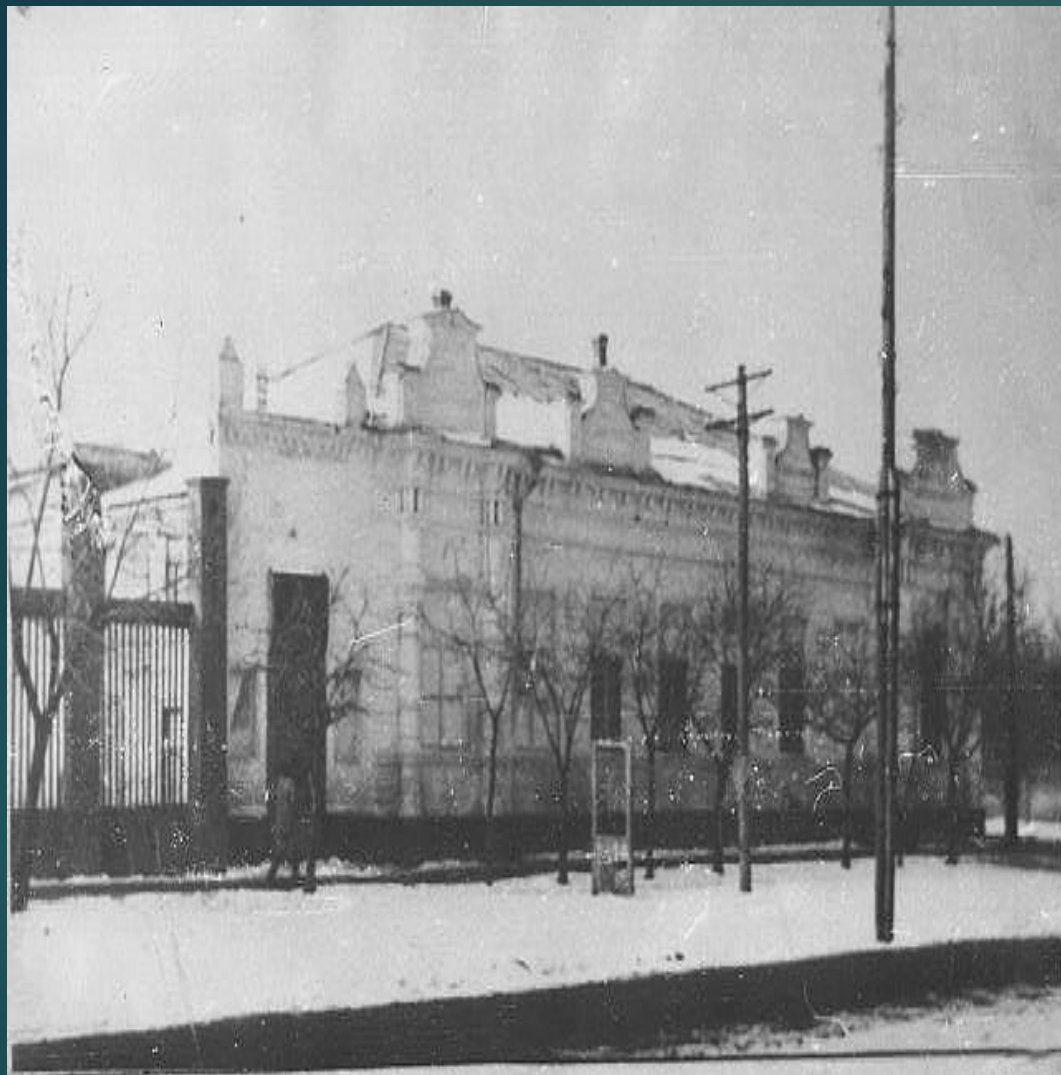
Старое помещение район. Дома культуры до 1949г.