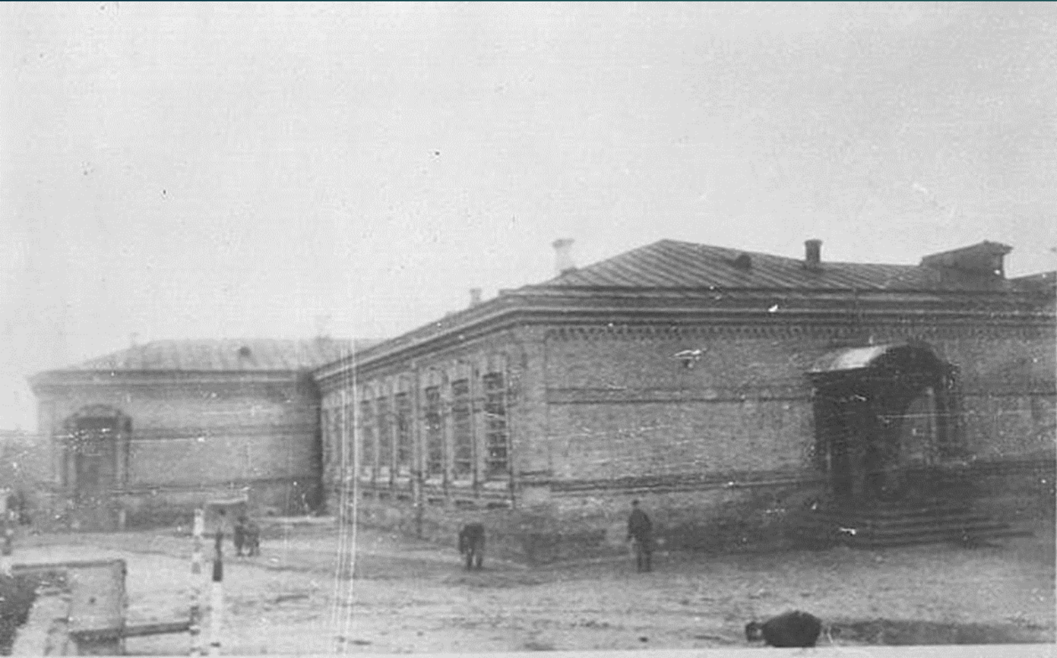
Здание СШ № 2 в 1958 году