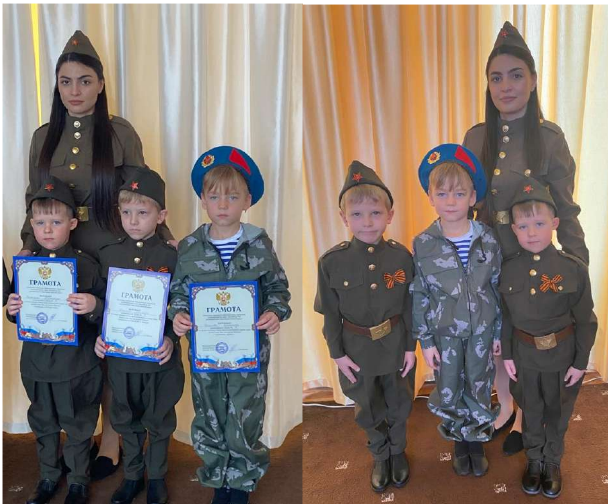
Посещение историко-краеведческого музея