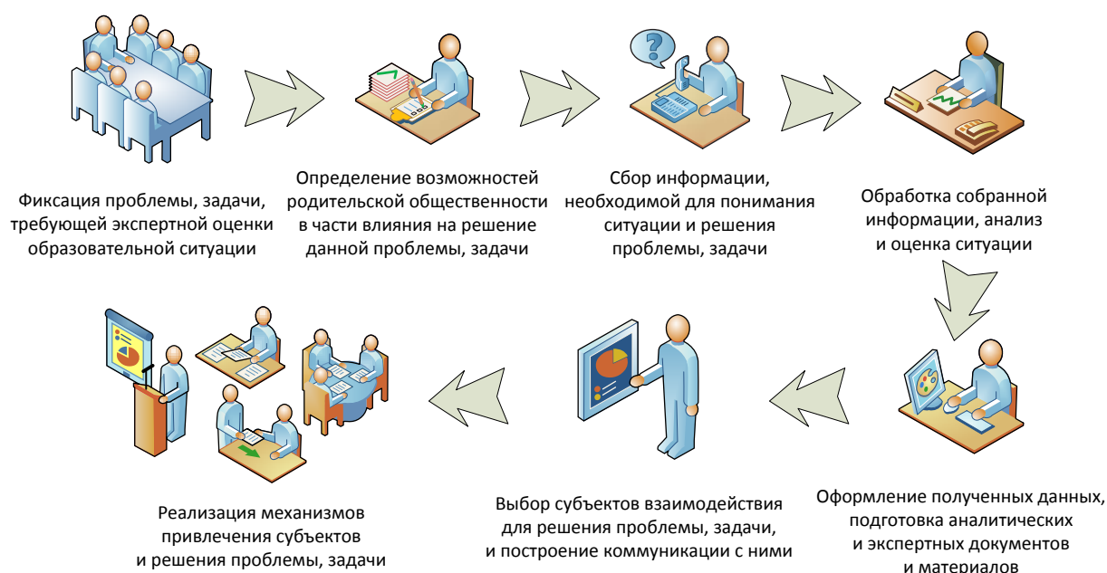
Рисунок 1. Алгоритм проведения экспертизы образовательных ситуаций

Проведение оценки качества деятельности образовательной организации можно представить в виде следующего алгоритма действий (рис. 1):