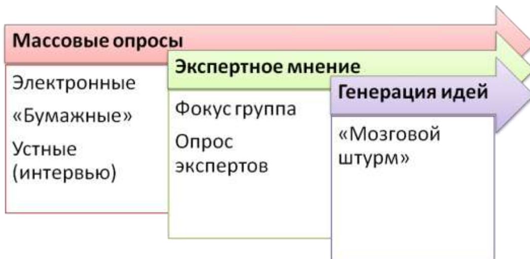
Рисунок 1. Методы выявления общественного мнения

Самым сложным при подготовке и проведении анкетирования является разработка самой анкеты. Здесь существует множество правил и способов, обеспечивающих достоверность и надежность отчетов. Эта работа, действительно, требует специальной подготовки. Поэтому лучше всего воспользоваться готовыми анкетами, которые были ранее разработаны профессионалами. Внесение в такие анкеты небольших изменений, как правило, не сильно сказывается на качестве результатов, если речь идет о прикладном исследовании в рамках одной, отдельно взятой школы.