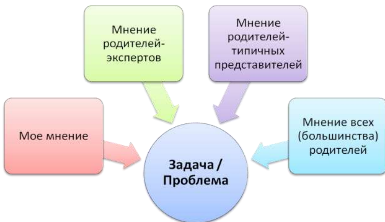
Рисунок 2. Модель выявления проблемы или задачи развития образовательной организации методом расширения круга заинтересованных субъектов.

Начать эту работу можно с формулировок проблем, актуальных для основных инициаторов данной работы (рис. 2).