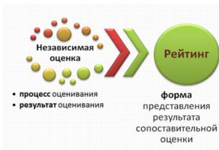
Рисунок 5. Схема формирования рейтинга в процессе проведения оценки

Если не проводится сопоставление разных школ между собой, то построить рейтинг невозможно. С другой стороны, – если в результате мониторинга или иной оценочной процедуры появляется база данных (набор оценок) по разным образовательным организациям, то неизбежно возникает соблазн выстроить эти школы по порядку: от лучших – к худшим. Так возникает рейтинг.