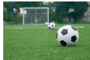
Специальная олимпиада России