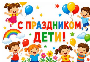
День защиты детей