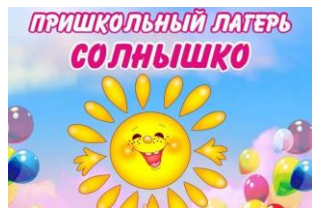
Оздоровительный лагерь «Солнышко»