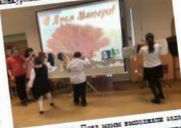
Красивые стихи в честь мам и бабушек рассказали ученики начальной школы и 6-7 классов. Высшей оценкой «Риски» поделились младшие ребята. Завершился праздник...