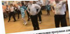
Далее началось конкурсная программа для мам. Всего было 3 соревнования «Замечательная мамаша», «Собери портрет» и «Рисуйся балла»